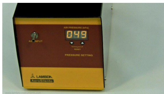
Figura 1-2 Encienda el interruptor para la entrada de corriente proveniente de la línea principal en la parte trasera del compresor. El monitor indica la presión real.