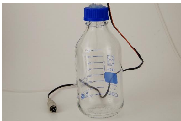
Figura 4-3 Botella del condensado, la cual está hecha de cristal químico muy resistente a presión. El tapón lleva la toma de la entrada de aire y la parte baja del tubo de entrada del condensador es enroscada a la botella del condensado. La botella del condensado tiene que estar protegida de los choques y tiene que mantenerse en una cubierta o soporte protectores.