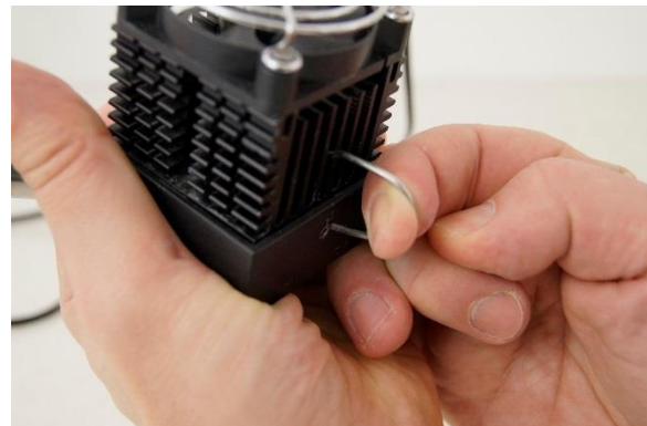
Figura 4-8 La pinza de cierre tiene que ser alada firmemente a través del elemento de enfriamiento Peltier con los componentes electrónicos de control y el ventilador y fijada dentro del hueco en ambas caras de la celda, para asegurar el sistema, bucle (serpentín) de enfriamiento Peltier intacto o en una sola pieza.

Figura 4-7 La celda Peltier unida con el dedo de condensación debe ser mantenida unida con ayuda de una pinza de cierre.