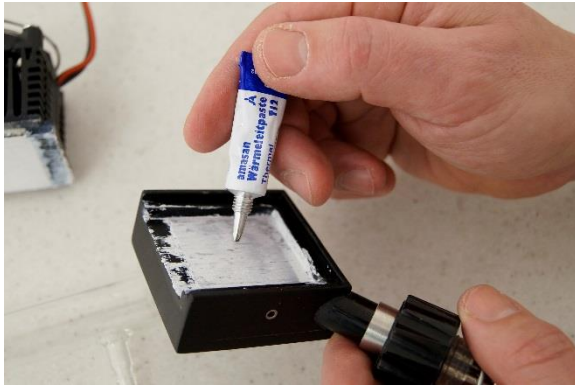
Figura 4-5 Aplique la pasta conductora de calor en la superficie blanca del elemento de enfriamiento Peltier con los componentes electrónicos de control y el ventilador, antes de unir el dedo de condensación con la unidad. Esparza delicadamente la pasta conductora de calor en la superficie regular asegurándose de que no existan burbujas de aire atrapadas.