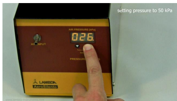
Figura 1-4 Presione el botón de la flecha ▼ y ▲ una vez para fijar la presión deseada en kPa. La velocidad del motor del compresor será ajustada automáticamente para el flujo o caudal requerido hasta que se alcance el valor prefijado.