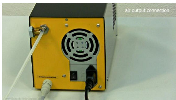
Figure 1-1 Conecte el tubo o manguera en la toma de aire (protuberancia o tubo de metal sobresaliente) en la parte trasera del AeroSilento y para el punto de colocación del tubo o manguera en el instrumento o recipiente al cual se le suministrará el aire comprimido. (e.j. a la toma de la entrada de aire en la parte trasera del biorreactor-fermentador LAMBDA MINIFOR).

La calibración y puesta a punto del LAMBDA AeroSilento es simple y fácil, puede encontrar un video corto en la siguiente dirección: http://lambda-instruments.com/?pages=video-pressure-regulated-oil-free-air-compressor-aerosilento .