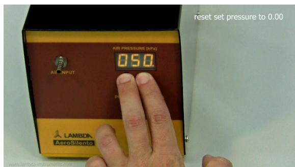
Figura 1-5 Cuando ambos botones de flechas ▼ y ▲ son pulsados simultáneamente el compresor se reinicia a 0 kPa.