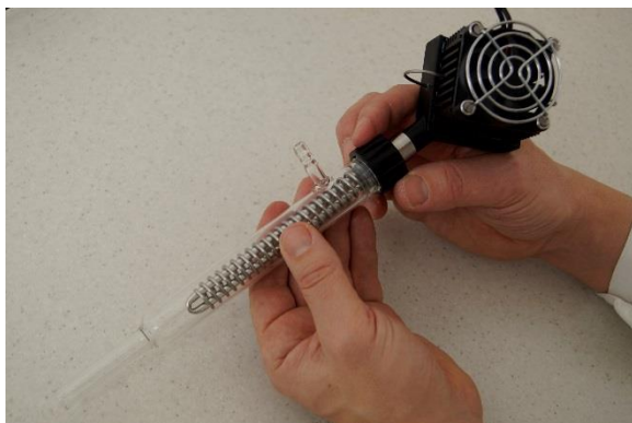
Figura 4-9 Inserte el cilindro condensador del gas de salida con la conexión de la tubería o manguera sobre el dedo de condensación y apriételo o asegúrelo con la tapa negra con rosca.