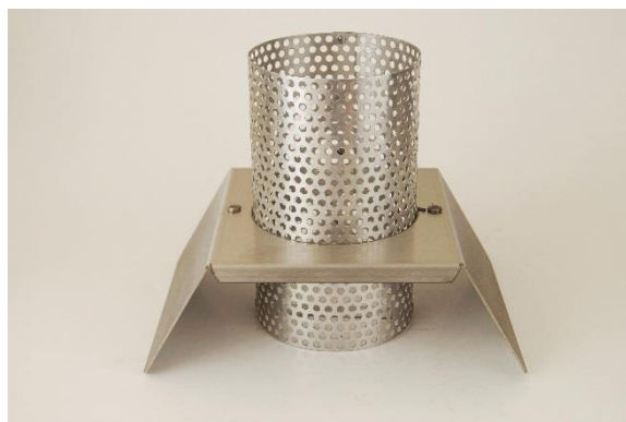
Figura 4-4 La cubierta o soporte de protección sostiene de forma segura la botella del condensado en una posición vertical y protege contra piezas cristal que vuelen en caso de la ruptura accidental del cristal. Las aperturas en su escudo permiten ver cuánta agua se ha acumulado. Vacíe la botella cuando sea necesario.