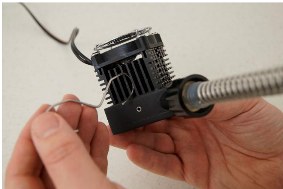
Figura 4-7 La celda Peltier unida con el dedo de condensación debe ser mantenida unida con ayuda de una pinza de cierre.

Figura 4-6 Una el elemento de enfriamiento Peltier con los componentes electrónicos de control y el ventilador con el dedo de condensación colocando la superficie blanca con la pasta conductora de calor en la trampa respectiva en la unión del dedo de condensación como se muestra.