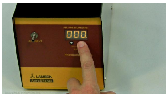
Figura 1-3 Presione el botón de la flecha ▼ o ▲ una vez, para ver el valor previamente fijado. Un punto se muestra y observa a continuación del último dígito.