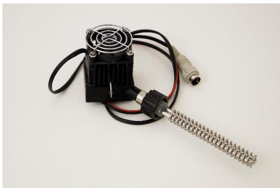
Figura 4-1 Celda electro térmica Peltier, la cual genera frío (por lo que no es necesario ningún sistema de enfriamiento del agua). La temperatura del lado frío está electrónicamente controlada cerca de +4^{\circ}\text{C} . Esto evita la congelación y condensación del agua y el bloqueo de la vía del aire. Un pequeño LED en el frente de la unidad Peltier muestra cuando la corriente es encendida y apagada. El cable de la celda Peltier está conectado al enchufe correspondiente en la parte trasera del compresor de aire AeroSilento.