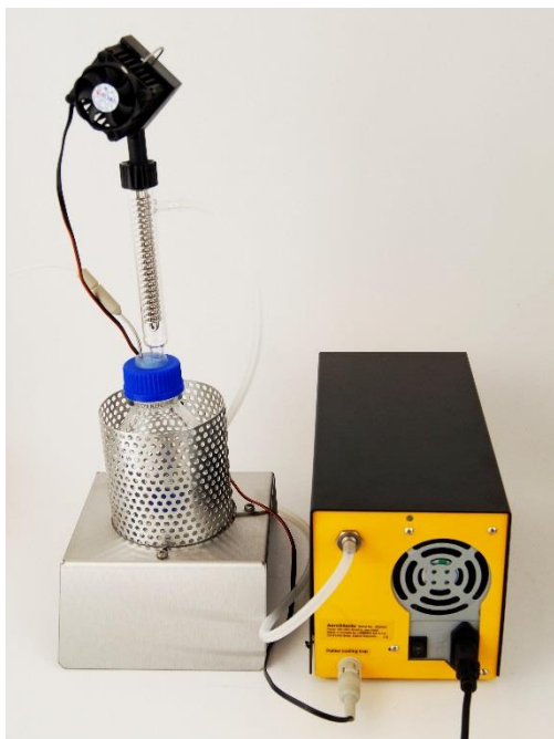
Figura 4-12 Conecte la entrada de la botella del condensado a la salida de aire en la parte trasera del compresor AeroSilento y asegure el lugar.

De forma similar, conecte la salida del tubo condensador a la entrada de aire del MINIFOR por medio de tubos o mangueras. (Utilice los tubos de silicona de 5 mm suministrados de diámetro externo con un ancho de pared de 1 mm para proteger su instrumento de la sobrepresión y también para incrementar la capacidad de amortiguación de la presión)