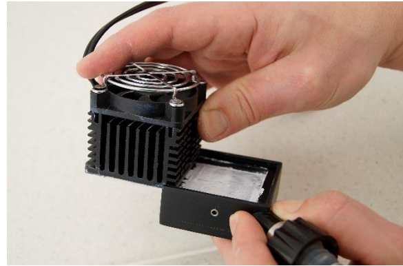
Figura 4-6 Una el elemento de enfriamiento Peltier con los componentes electrónicos de control y el ventilador con el dedo de condensación colocando la superficie blanca con la pasta conductora de calor en la trampa respectiva en la unión del dedo de condensación como se muestra.

Figura 4-5 Aplique la pasta conductora de calor en la superficie blanca del elemento de enfriamiento Peltier con los componentes electrónicos de control y el ventilador, antes de unir el dedo de condensación con la unidad. Esparza delicadamente la pasta conductora de calor en la superficie regular asegurándose de que no existan burbujas de aire atrapadas.