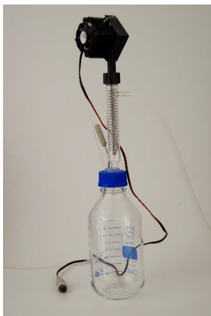
Figura 4-10 Fije el cilindro condensador con el Sistema, bucle o serpentín de enfriamiento Peltier a la botella del condensado.