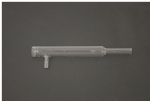
Figura 4-2 Tubo condensador, donde el aire de entrada pasa a lo largo del dedo de enfriamiento de metal en el cual se condensa el vapor de agua y cae o gotea en la botella del condensado.